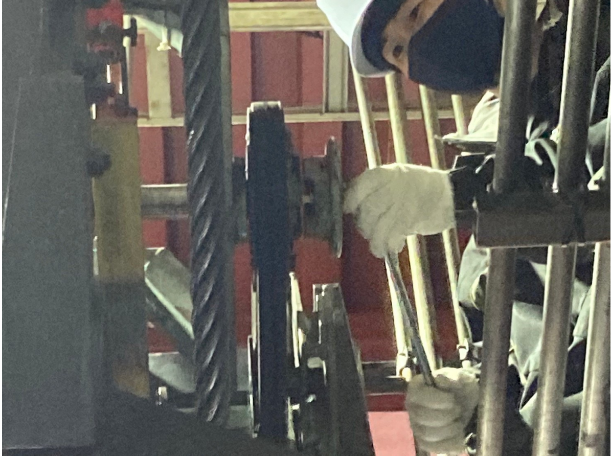
6.ニポチェア・ロマンステェア 電動機オーバーホール